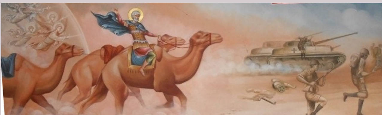
Helgonets deltagande i striden vid Alamein, skildrat i en fresk i Megisti Lávrá-klostret på Athos