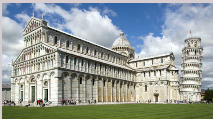
Pisas fantastiska katedral