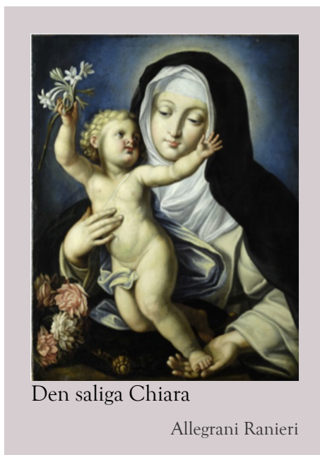
Den saliga Chiara