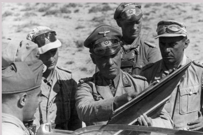
Rommel, "ökenräven", med några av sina officerare.