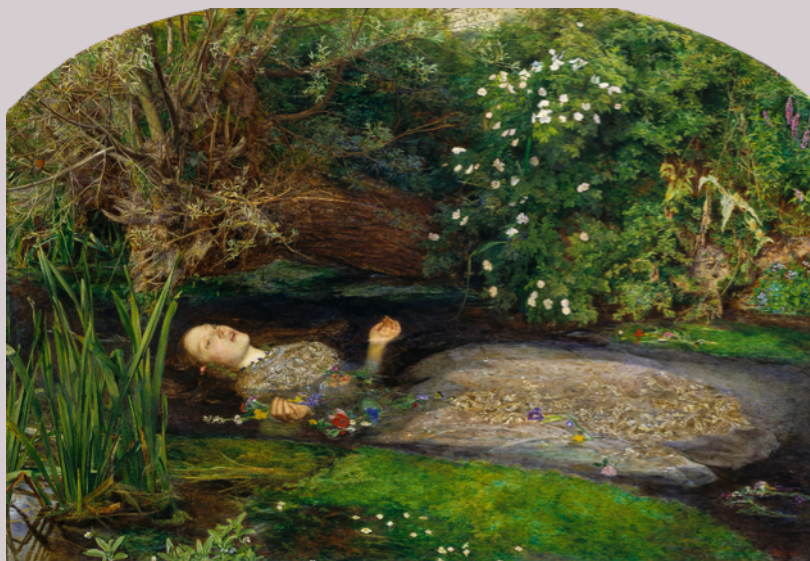
"Ofelia" av Millais

Präglade av John Ruskins tankar studerade pre-rafaeliterna noga varje detalj i naturen som de ville föra in i sina bilder. John Everett Millais "Ofelia" ger ett exempel på detta.