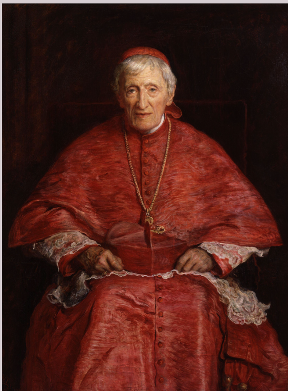
"John Henry Newman" av Millais