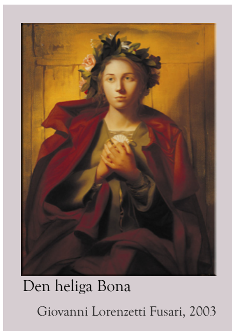
Den heliga Bona