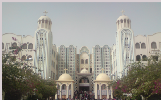
Den helige Menas kloster idag, i närheten av den ursprungliga vallfartsorten Abu Mena.

bäddade för det andra stora slaget vid El Alamine, det som allas vår St Mena törhända var med och avgjorde.