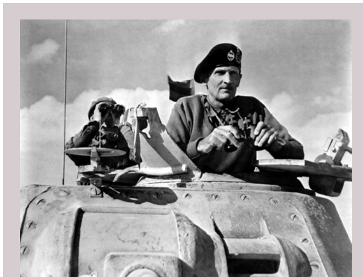
Fältmarskalk Bernard Montgomery, 1942.

ifrågasättas. Men vi kan nämna att en rapport om händelsen fanns i Egyptian Gazette den 10 november 1942. Då var slaget vid El Alamein sedan en knapp vecka tillbaka vunnet och tyskarna befann sig på reträtt. Ett år senare, på St Menas festdag den 11 november,