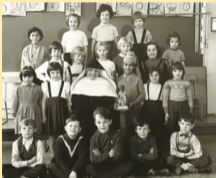
Syster Bonaventuras klass, 1940.

Systrarna försörjde sig med hjälp av sömnadsarbeten av allehanda slag. Biskopens råd till dem att tigga pengar av katolska sjömän i hamnen hörsammades icke. Men stort stöd fick man från föräldrarna, vilka 1956 bildade den första föräldraföreningen och tillsammans med systrarna höll den första julbasaren. Syftet var att samla in pengar till en ny skola och basaren blev en succé, som kom att leva kvar i många år och med tiden närmast antog institutionell karaktär i Göteborg och för stadens invånare. Katolska församlingens julbasar helgen före 1:a advent var något man började prata om veckor och månader i förväg. En del pengar till skolan blev det också, även om det naturligtvis inte räckte hela vägen fram. Men 1962 stod den nya skolan invid Kristi Konungens kyrka intill Heden klar och kunde tas i bruk. Den