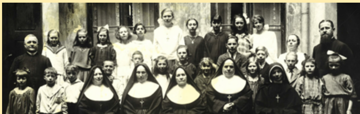
En bild från tiden på Spannmålgatan.

Ofta var motvinden isande kall. Åtminstone vid ett tillfälle, 1879, stängde myndigheterna tillfälligt skolan med motiveringen att det bedrevs katolsk propaganda. Syster Gasparin öppnade igen. Hon var priorinna i 37 år fram till sin död 1910. Då var byggnaderna på Östra Hamngatan 9 och Spannmålgatan 10 i behov av reovering och verksamheten