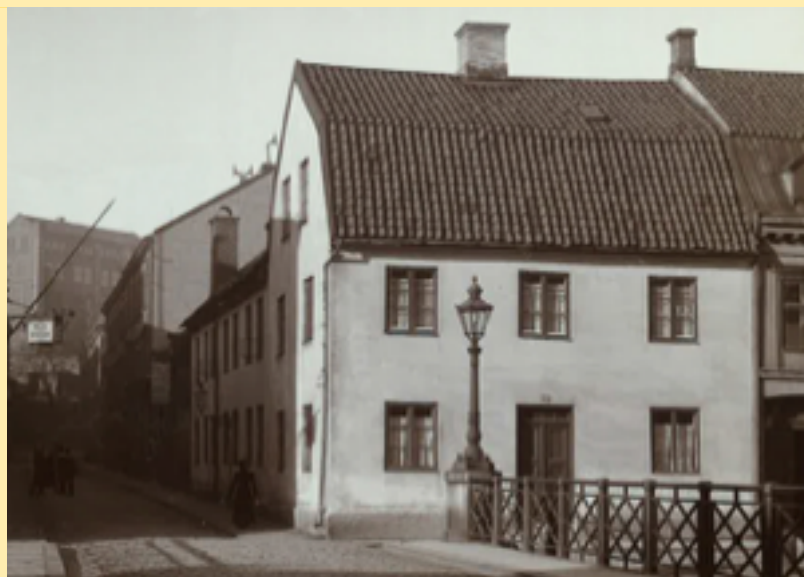
Huset på Östra Hamngatan 9.

Det tog förstås sin tid. Det var inte gjort i en handvändning. Många pusselbitar skulle falla på plats. Och under rätt lång tid hankade sig verksamheten fram. Systrarna hade initialt fyra elever, som de undervisade i sitt hus på Östra Hamngatan 9. Huset var inköpt av