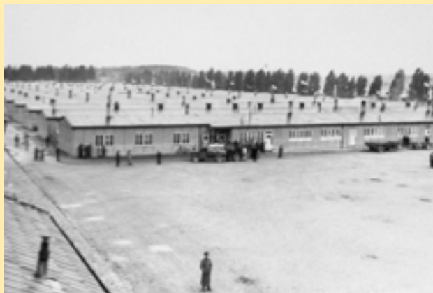
Dachaus baracker.

"En katolsk präst skickades till Dachau för att han gjort gällande att det fanns goda människor i England också. En annan för att han varnat en flicka för att gifta sig med en SS-man sedan hon avsvurit sig sin katolska tro. En tredje för att han hållit en begravning för en avliden kommunist ... "