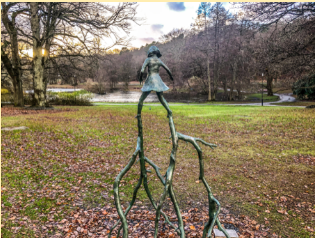
Klara Kristalova, "Det som håller mig kvar, bär mig vidare", skulptur i Slottsskogen, 2018.

Man kanske inte vågar omfatta trons sanning eftersom man fattat så många beslut tidigare i livet på andra grunder än tron. Man vill försvara sina val, sina ställningstaganden och projekt även om man i nåden sol anar att det är tid att ompröva allt detta. Man kan också tänka på inövade vanor, beteendemönster, ja också laster, som blivit till stabila hållningar i det egna livet. Dessa har formats i sammanhang man fått eller valt att tillhöra, av beslut man en gång fattade, av andras beslut som påverkat en o.s.v. Denna bakgrund har blivit ett med en och det är svårt att komma loss och växa. Bakgrunden håller en kvar.