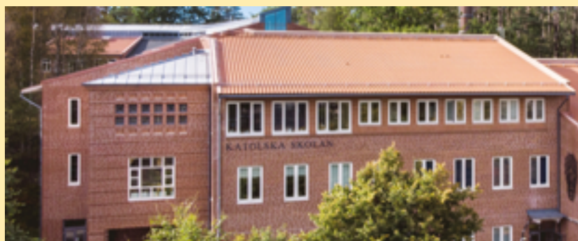
Skolbyggnaden i Örgryte blev kronan på skolsystrarnas verk. 23 år senare är den fortfarande lika fin.