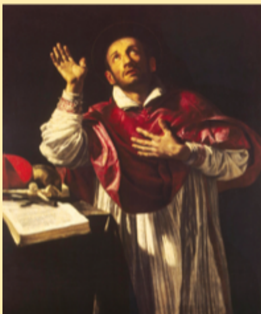
Den helige Carlo Borromeo. Borgianni.

Att mässor inte firas för allmänheten i kyrkorna p.g.a. en epidemi är inget nytt i Kyrkans historia. Ett historiskt exempel som aktualiserats den senaste tiden är då Helige Carlo Borromeo stängde alla Kyrkor i Milano under c:a två år (1576-1577) tills en epidemi var över. Istället uppmuntrade han prästerna att fira mässor ute på gatorna så att folket kunde delta – antingen genom att betrakta mässan från sina fönster, eller genom att gå ner på gatan. På den tiden var det relativt ovanligt att lekfolket mottog den sakramentala kommunionen, och det vi idag kallar för ”andlig kommunion” var det vanliga. Förmodligen var därför utdelandet av kommunionen inte en brinnande fråga den gången. Situationen i Milano har sina likheter och