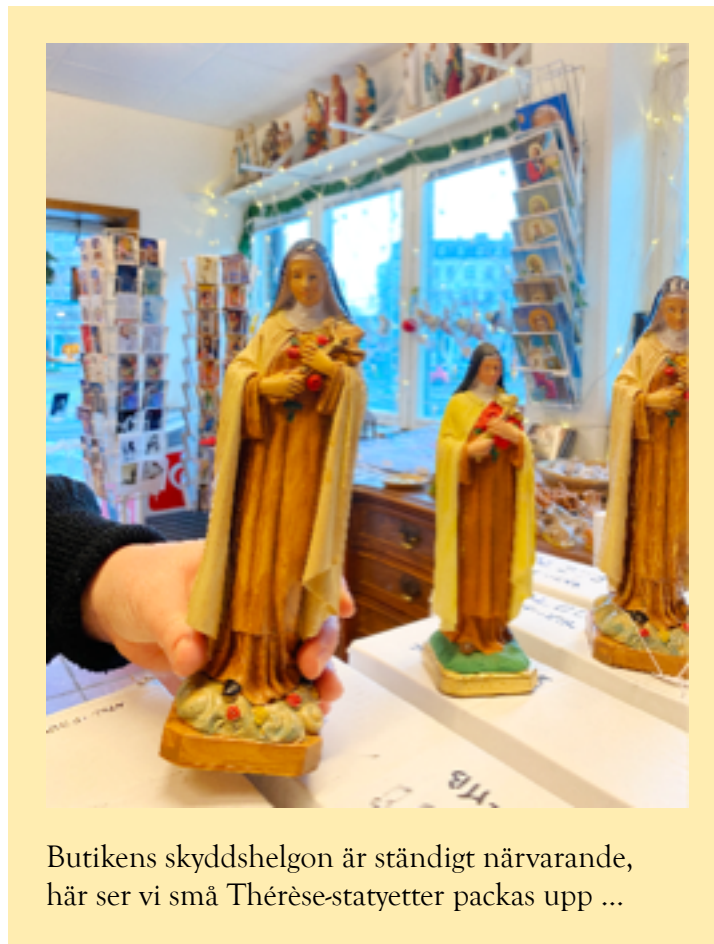
Butikens skyddshelgon är ständigt närvarande, här ser vi små Thérèse-statyetter packas upp ...