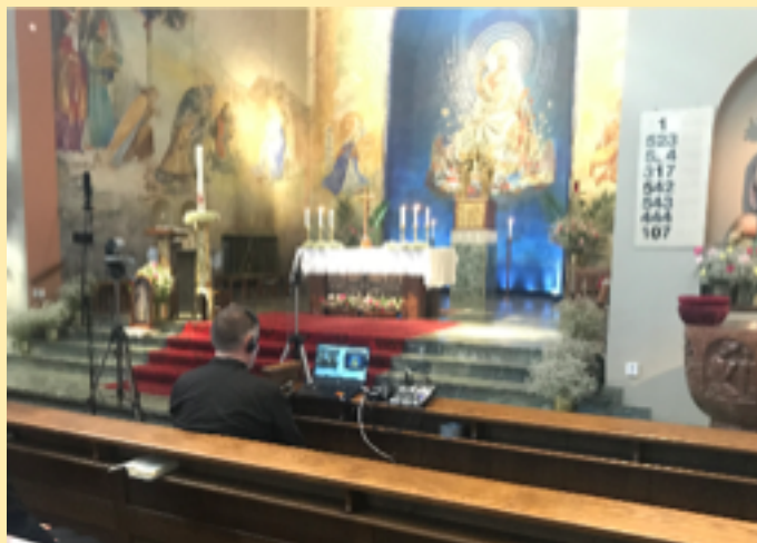
Numera sitter vår diakon i kyrkbänken ...

som tittade och även återkom som jag fann den pastorala vinkeln som diakon. Arbetet jag utför är ju ett sätt att medverka i gudstjänsten. Jag sprider Ordet till dem som inte kan komma. Det är en tjänst. Som diakon tjänar jag härigenom kyrkan och församlingen.