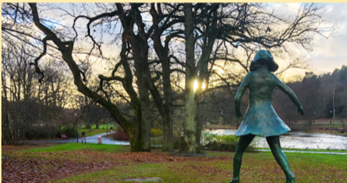
Klara Kristalova, "Det som håller mig kvar, bär mig vidare", skulptur i Slottsskogen, 2018.

Vi har alla en historia, ett grenverk av händelser och beslut som vi mer eller mindre kunnat råda över. Allt detta kan, i det andliga livet, "hålla en kvar." Man fastnar och växten under nådens sol hindras.