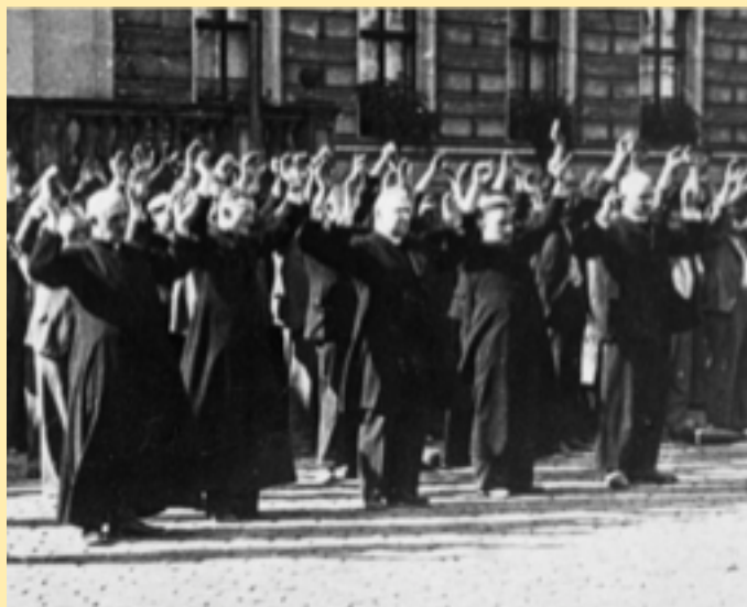
Främst bland de arresterade i den polska staden Bydgoszcz syns fyra präster.

ansiktet. Prästen fick höra bikt, men endast i närvaro av en SS-officer – och sedan han fått veta att endast två fångar hade önskemål om att få fira mässan uteblev han till sist helt.