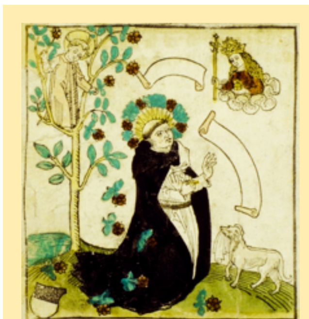
Heinrich Seuse / Henricus Suso

berättade att Gud hade sänt honom för att låta honom ta del av den himmelska glädjen mitt i sitt lidande. Ängeln tillade att han måste kasta bort alla sina sorger från sitt sinne och ansluta till deras sällskap i himmelsk dans. Sedan förde de tjänaren in i dansen, och ungdomen började en glädjesång om Jesusbarnet ..."