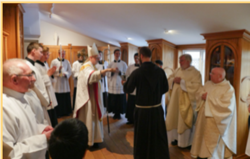
Den 26 augusti 2018 välsignade kardinalen den nyinredda sakristian.