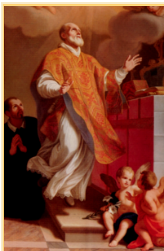
"Sankt Filippo Neri i extas"