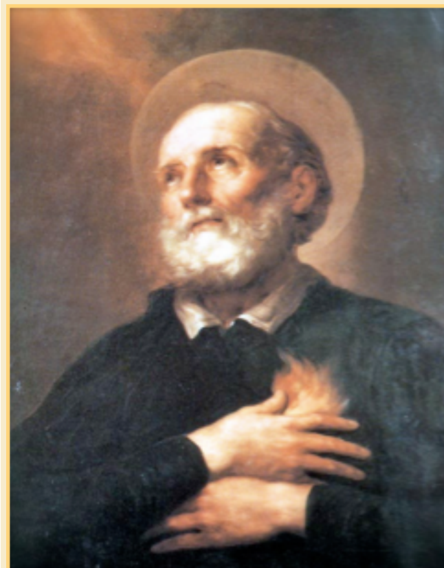
Den helige Filippo med Guds kärleks eld brinnande i bröstet.

den 23 maj 1551 prästvigdes han. Dessförinnan hade han varit med om en extraordinär och livsavgörande upplevelse. Filippo hade för vana att före nattens vila och bön dra sig undan till en kyrka eller ännu hellre ner i de gamla katakomberna. En natt därnere i mörkret fick han plötsligt se ett eldklot komma farande rakt emot honom. Av allt att döma gapade han av häpnad, för det for in genom hans mun och ned i hans bröst där det trängde in i hans hjärta. Elden var Guds kärlek och Filippo kände med bävan hur hjärtat svällde och växte tills han utmattad föll