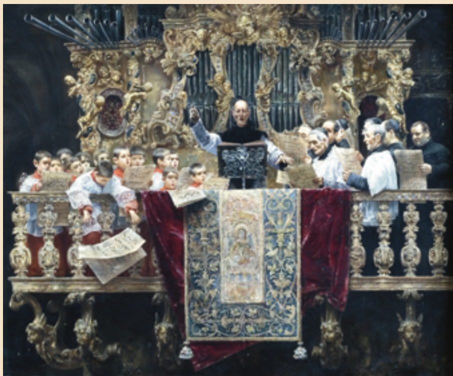
"Gosskören" av Jose Gallegos

vilka upplevelser och minnen de får genom att höra och vara i musiken på läktaren till Guds ära! Detta är en stor glädje. Barnen är där . De står med oss vuxna inför Lammets tron och de tillber lammet på sitt eget speciella sätt.