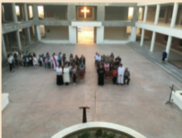
Mässa under bar himmel i Erbil, Irak