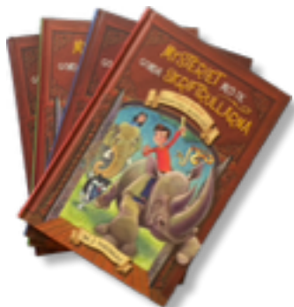
Mysteriet med de gömda skrifterullarna Kristen spänningsläsning för barn i bokslukaråldern ...

Dagligt missale för lekmän, rikt illustrerad.