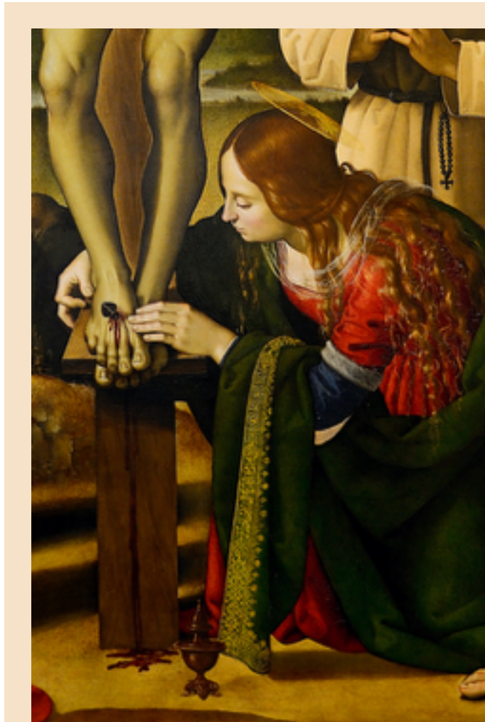
Maria Magdalena vid korsets fot. Detalj från Pietro Peruginos "Kristi korsfästelse".

dyrbar nardusolja och torkar dem med sitt hår. Under St Gregorius den stores tid vinner denna uppfattning terräng och man tänker sig att båda berättelserna i själva verket handlar om Maria Magdalena. I det medeltida västerlandet är hon både Maria i Betania och synderskan i farisén Simons hus. Konsten förstärker