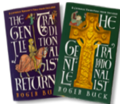
The Gentle Traditionalist Mycket efterlängtrad läsning äntligen i butik