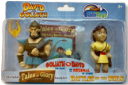
Bibliska Actionfigurer David, Petrus, Jona, Mose, etc.

Extra efterlängtrade vårnyheter - nu i butik!