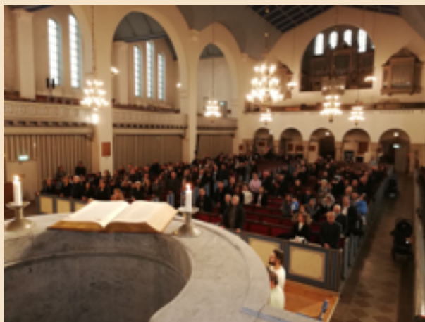
Utsikt från predikstolen en söndag i Annedalskyrkan