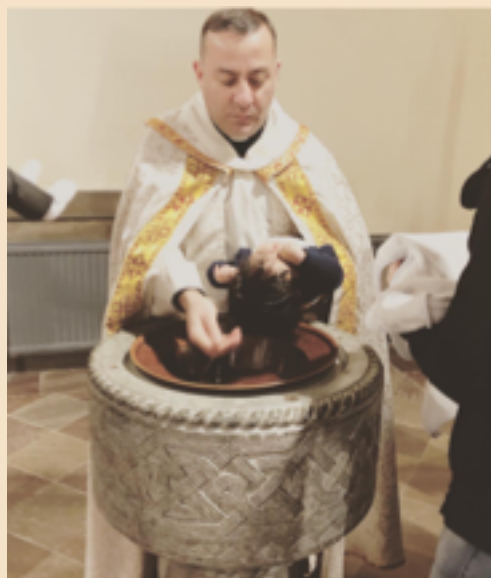
Dop i Annedalskyrkan