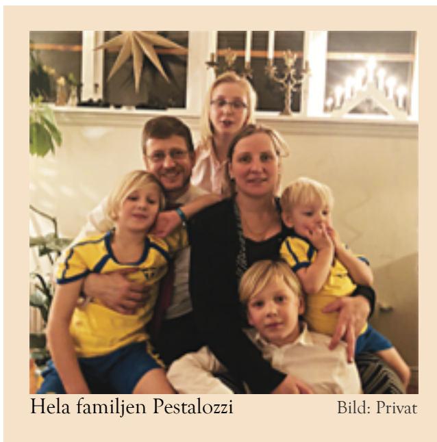
Hela familjen Pestalozzi

inleds med den. Vi blickar framåt och ser på hur vi kan föra tron vidare till framtida generationer. Familjeträffarna är som sagt ett nytt koncept och vi prövar oss fram. Det finns många möjligheter. Självklart är träffarna också ett sätt att föra ut och så att säga marknadsföra Katolska skolan. Många känner inte till att den finns och vilken profil den har. Familjeträffarna blir ett nytt forum – och alla familjer är välkomna!