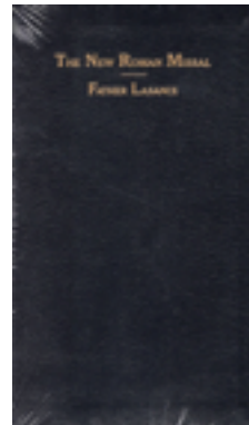
The New Roman Missal, fr Lasance, Fraternity publications

Dagligt missale för lekmän, rikt illustrerad.