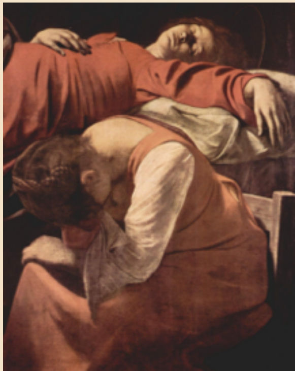
Maria Magdalena närvarande vid Jungfru Marie insomnande. Caravaggio.