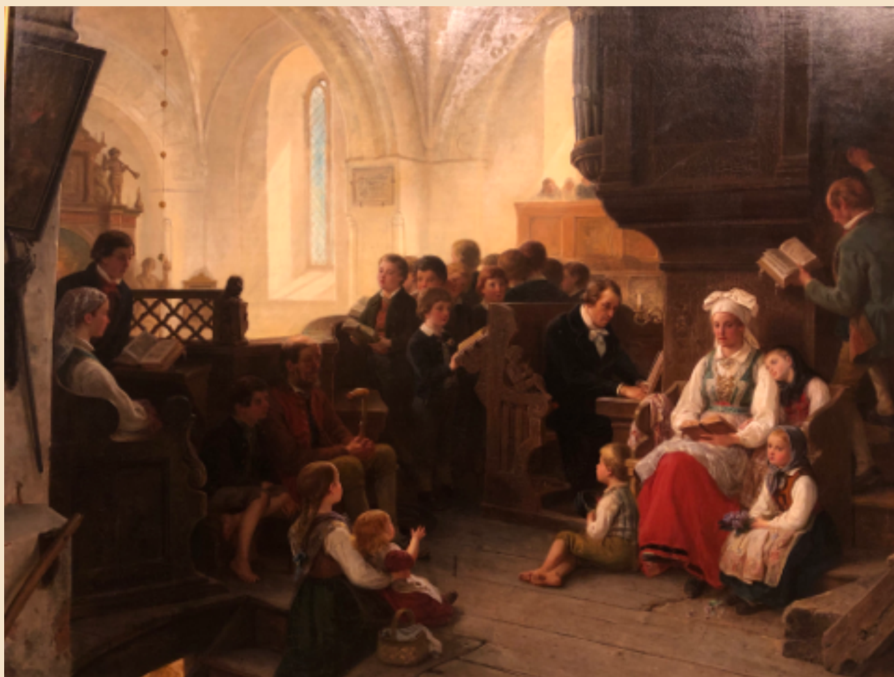
"Orgelläktaren" av Bengt Nordenberg