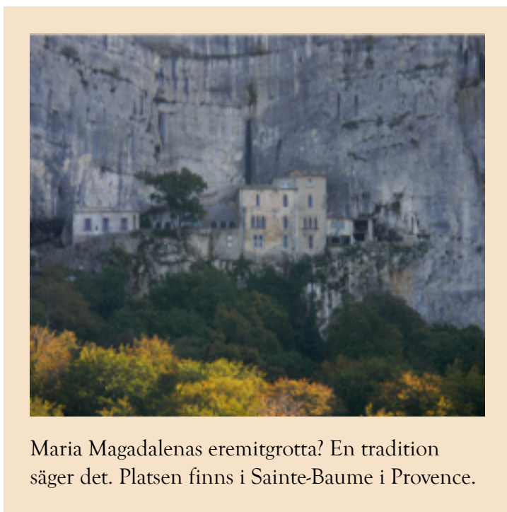
Maria Magdalenas eremitgrotta? En tradition säger det. Platsen finns i Sainte-Baume i Provence.

Det var här Bernhard av Clairvaux utropade det andra korståget 1146 och här bannlyste Thomas Becket 1166 den engelske kungen Henrik II, som förresten fyra år senare hämnades genom att skicka fyra av sina edsvurna män, Reginald Fitzurse, William de Tracy, Hugh de Morville och Richard le Breton, till Canterburykatedralen för att mörda den sedermera helgonförklarade ärkebiskopen. Men relikerna efter Maria Magdalena hade munkarna i