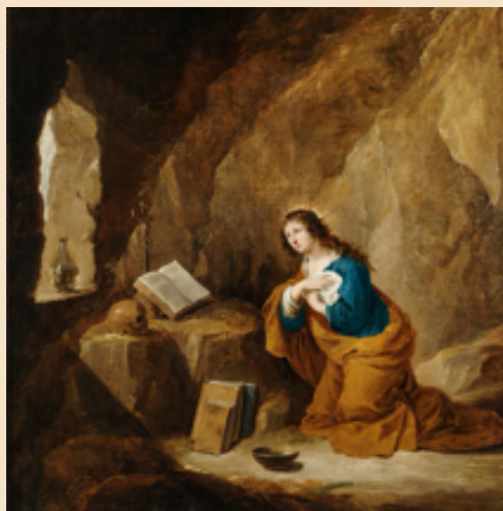
Maria Magdalena som eremit i Provence. David Teniers d.y.