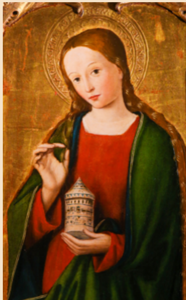
Maria Magdalena med oljekruset. Bilden finns i Monacos katedral.

Byn vars namn fogats till henne eget var belägen på västra stranden av Galileiska sjön, 4,8 kilometer norr om Tiberias. Av evangelierna kan i utläsa, att hon var en kvinna som följde Jesus och tjänade honom sedan