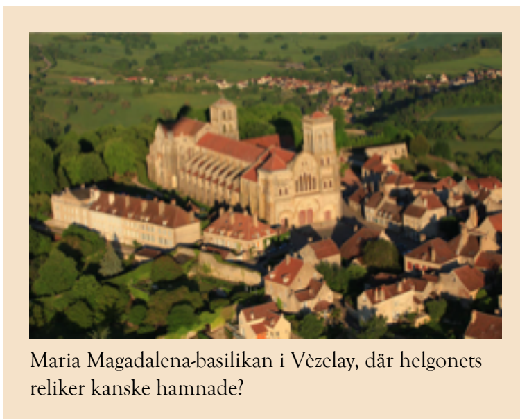
Maria Magdalena-basilikan i Vézelay, där helgonets relikers kanske hamnade?

Vézelay aldrig förmått visa upp. Och det föranledde naturligtvis Provence att anlägga mote